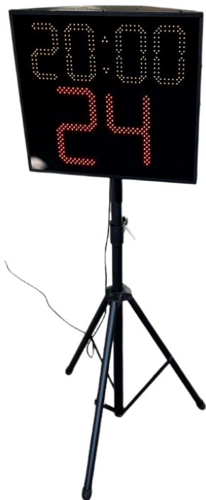
Тренога для монтажа на пол.